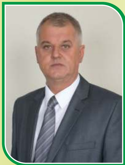
PREDSJEDAVAJUĆI OV SENAD SUBAŠIĆ (SDA)