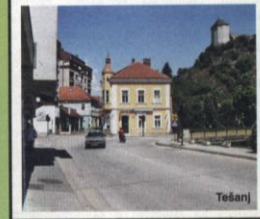
SLOBODNA BOSNA | 14.4.2011.

Među ostalim, FAD, MANN-HUM-MEL, AS, Belif, Dukat, HIFA, Jami, Artisan... koje visoko kotiraju na listi "100 najvećih kompanija u BiH".